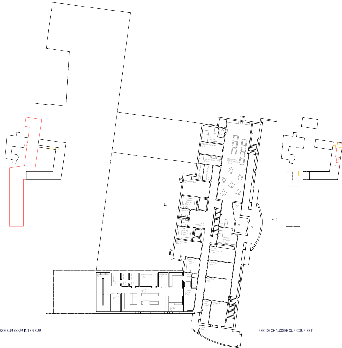
REZ DE CHAUSSEE SUR COUR EST